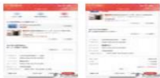
图片截取自黑猫投诉平台

本人于2021年9月19日在西部数据自营店上购买了一个移动硬盘，于同年11月2日发现该盘插上电脑后读取不了数据。到附近店里咨询，初步检验是磁头坏了，保数据修好需要1500左右。所存储的实验数据对我非常重要，是我两个多月夜以继日实验的成果，必须要恢复，而在我要求售后后，只同意换一个新的硬盘，并要求将旧硬盘连同数据收回；或者在其授权店自费开盘维修恢复数据后再换新硬盘。对此我不接受。因本人在持有该硬盘1个半月期间十分爱惜，没有跌落撞击等人为损害，这明显是商家产品质量不合格所致，对于商家产品本身的质量问题及造成我个人损失的，我要求退货退款，并赔偿我因数据恢复个人需要支付的维修费用。